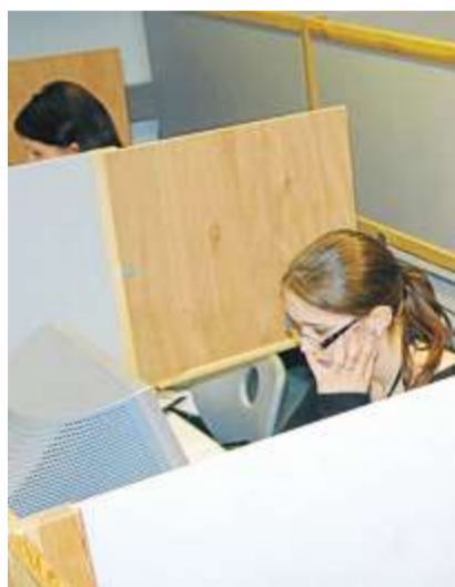
Spicken ist nicht drin, denn die Trennwände scheinen für die angehenden Bürokaufleute unüberwindbar.

NEUMARKT. Nach drei Jahren Lehrzeit sitzen derzeit 38 Bürokaufleute Version A (Industrie und Handelskammer) sowie 26 Auszubildende der Version B (Handwerkskammer) bei ihrer kaufmännischen Abschlussprüfung im EDV-Zentrum der staatlichen Berufsschule Neumarkt. Die Zahl der Absolventen ist im Vergleich zu 2009 damit konstant geblieben. Die Prüfung im Bereich Informationsverarbeitung besteht aus drei Situationsaufgaben, die mit Hilfe eines Textverarbeitungsprogramms (Word) und eines Tabellenkalkulationsprogramms (Excel) zu lösen sind. Laut Oberstudienrätin Judith Völkl folgt am 15. Mai die Prüfung in den Fächern Bürowirtschaft, Finanz- und Rechnungswesen, Wirtschaft und Soziales, dem sich Ende Juni die praktische (mündliche) Prüfung anschließt. (ngh)